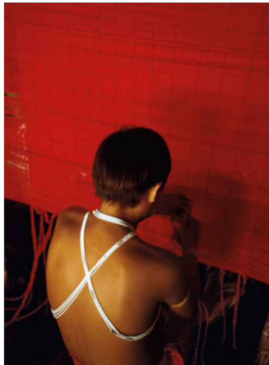
Brésil. Amazonie. Roraima. Indien Yanomami. 2008