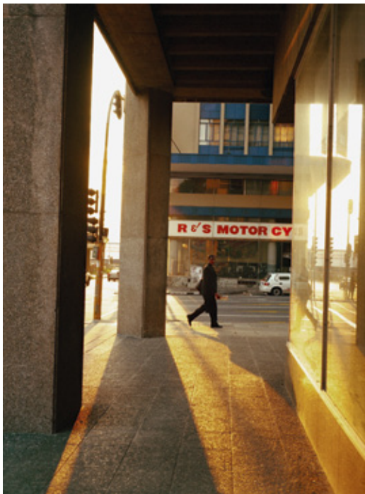
Afrique du sud. Johannesburg. 2006