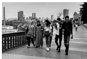
Série COMMUNES Causse-Bégon